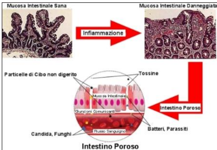
Fig. 1. Illustrazione di una mucosa intestinale sana e danneggiata con possibili conseguenze patologiche.

Evidenze sperimentali [6,8] suggeriscono che la disfunzione delle giunzioni strette sia concausa, ma forse la principale, per l'insorgenza di malattie infiammatorie immunologiche sistemiche, malattie infiammatorie croniche intestinali (MICI), allergie alimentari e celiachia [22,23]. Ciò sembra inoltre partecipare all'evoluzione dell'Autismo 2,12,13,14,15,16 . Complessivamente, i risultati di tutti questi studi mostrano o comunque sembrano suggerire che le malattie correlate con l'intestino permeabile possano scomparire e/o arrestarsi se la funzione di barriera intestinale del paziente viene ristabilita. Le prove a sostegno di tutto ciò sono ancora incomplete, ma sono abbastanza solide da incoraggiare i ricercatori a proseguirne il cammino intrapreso.